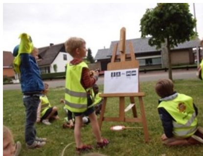
Turven van de verkeersdrukte