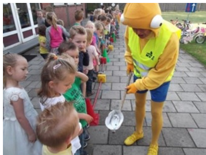
Controle van de vieze uitlaat van de auto