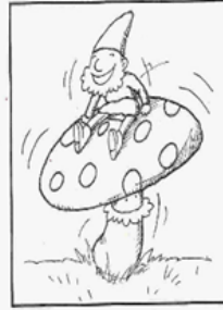
zat kabouter Spillebeen heen en weer te wippen.