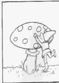
Op een grote paddenstoel rood met witte stippen,