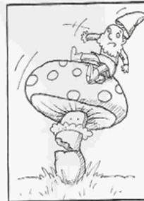
Kraks zei toen de paddenstoel met een diepe zucht.