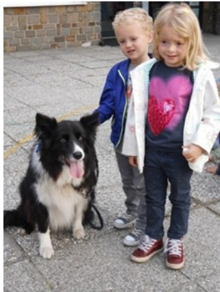
Samen wandelen met een hond van de hondenschool