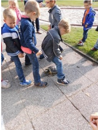
de reuzenschildpad speelt een spelletje mee ...