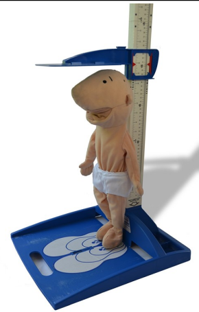
Als jij aan de beurt bent, mag je eerst onder de meetlat gaan staan. Zo kunnen we zien hoe groot jij bent.

Vaccinatieaanbod: 1e leerjaar, 5e leerjaar